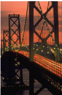
Caption describing picture or graphic.